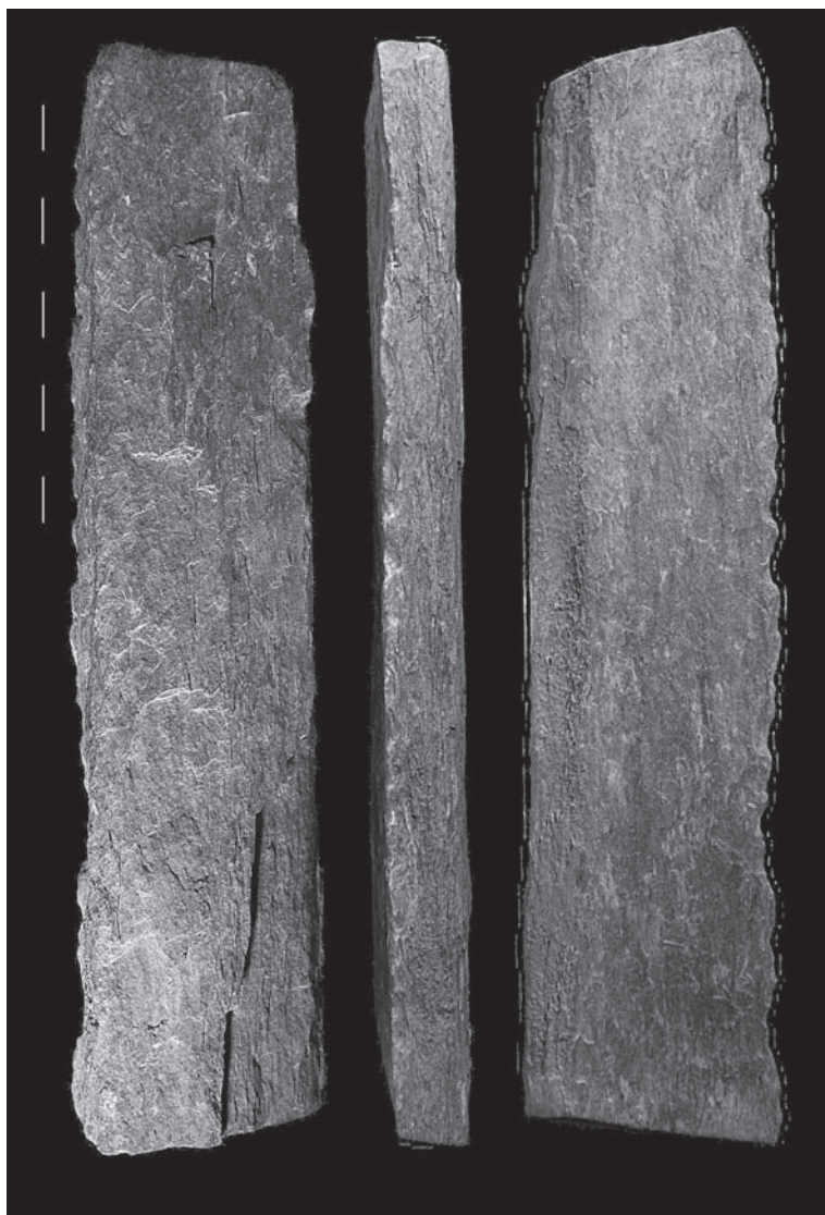
FIG. 5.3-3 – Fariseu, U.E. 4, plaquette en schiste local, dont l'un des tranchants a été volontairement denticulé.

Un objet découvert en 2005, dans le niveau d'occupation du Magdalénien final du site de Fariseu, nous révèle un autre type de transformation et probablement de fonction. Il s'agit d'une plaquette quadrangulaire en schiste local de la formation Desejosa de 23,9 x 5,5 x 2,2 cm, dont un bord a été modifié volontairement par des encoches régulièrement espacées (Fig. 5.3-3). Un examen tracéologique effectué par M. Araújo, n'a pas permis de détecter de trace d'utilisation qui se soit conservée. Néanmoins, en l'absence de référentiel expérimental, l'hypothèse de son utilisation sur un matériel tendre, animal ou végétal qui n'aurait pas laissée de trace ne peut être écartée.