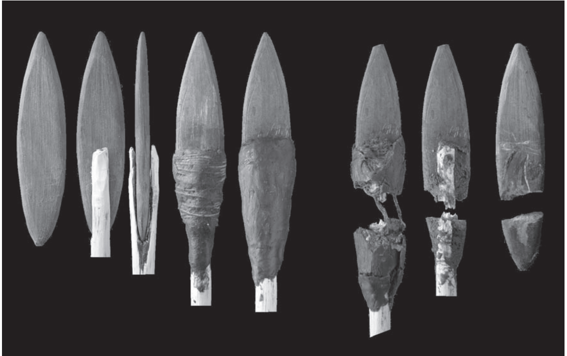
FIG. 5.3-2 – Cassure nette obtenue lors de l'un des tirs expérimentaux effectués avec une réplique des pointes en schiste de Olga Grande 4.

à une apparente fragilité suggérée par la schistosité propre à la matière première. Pour savoir si cette contradiction était fondée, nous avons initié des expérimentations, passant par la confection de copie, de leur montage et de leur usage comme armature axiale de projectile, à partir des différentes variétés de schistes régionaux, prélevé en place sur les affleurements, ou sous forme de galet.